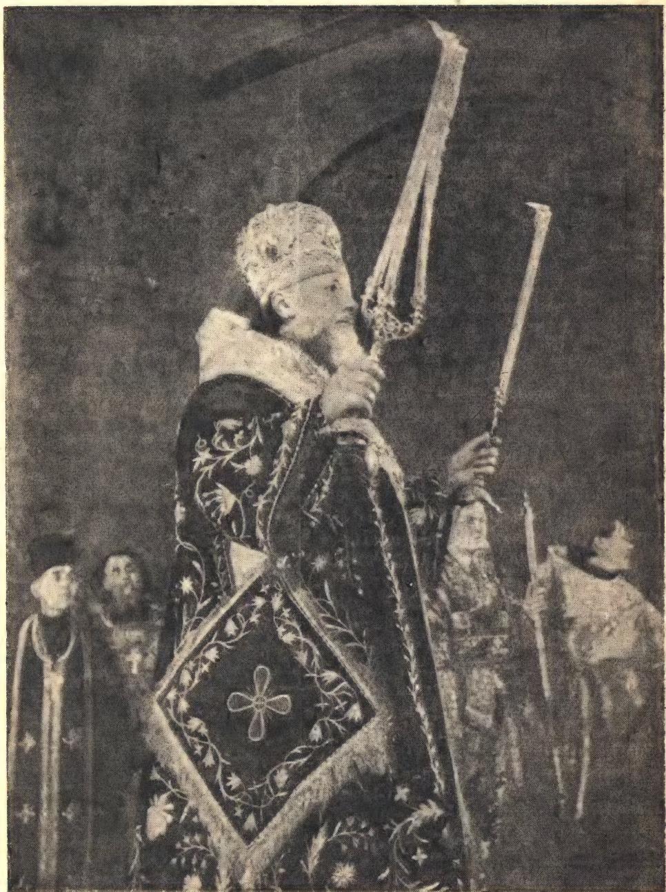
Святейший Патриарх Алексий за литургией в день интронизации